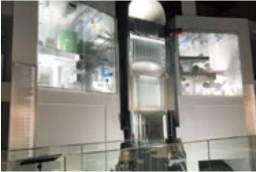
浜岡原子力発電所 5号機の1/4スケール原子炉模型