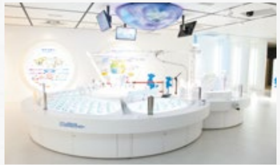
CO 2 スパイラルコースター

ケーションを取りながら進行していく、参加型・体験型展示としてリニューアルしました。