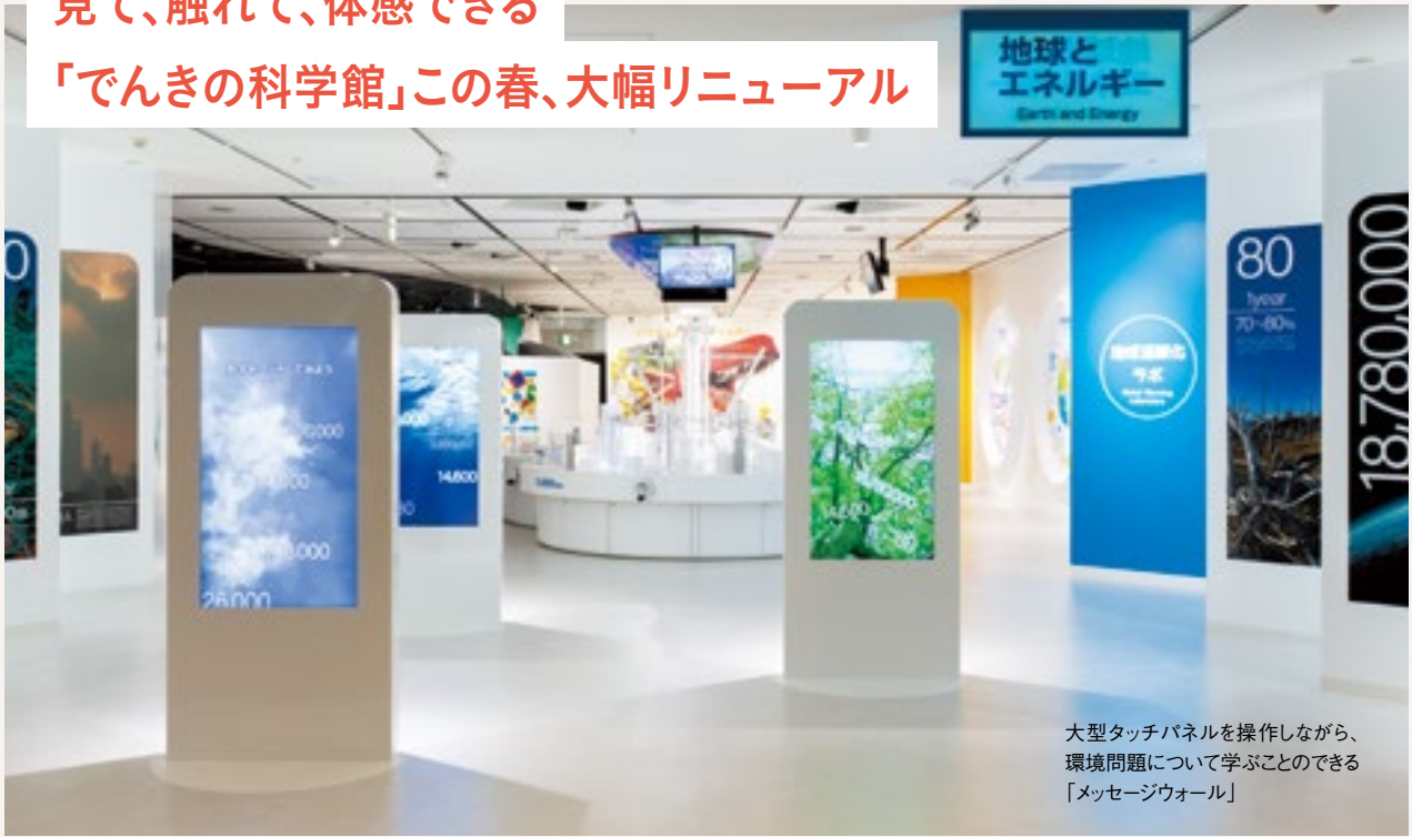
大型タッチパネルを操作しながら、環境問題について学ぶことのできる「メッセージウォール」