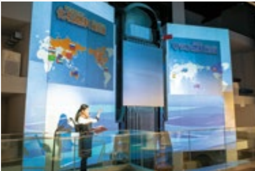
原子炉模型に映像を投影したシアターステージに変身