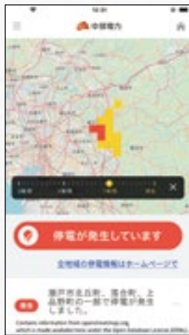
※地図はイメージ画像です。

▶分電盤操作に不慣れなお客様には、操作手順を画像でお送りすることで、操作の仕方をわかりやすくお伝えします。