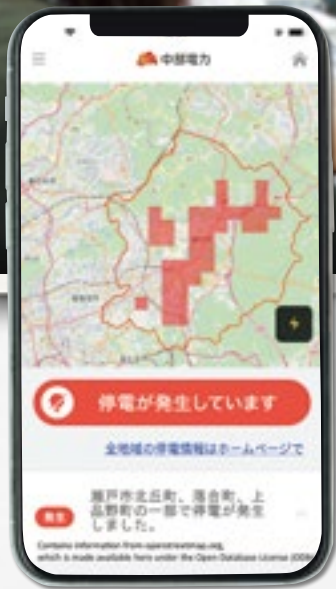
※地図はイメージ画像です。