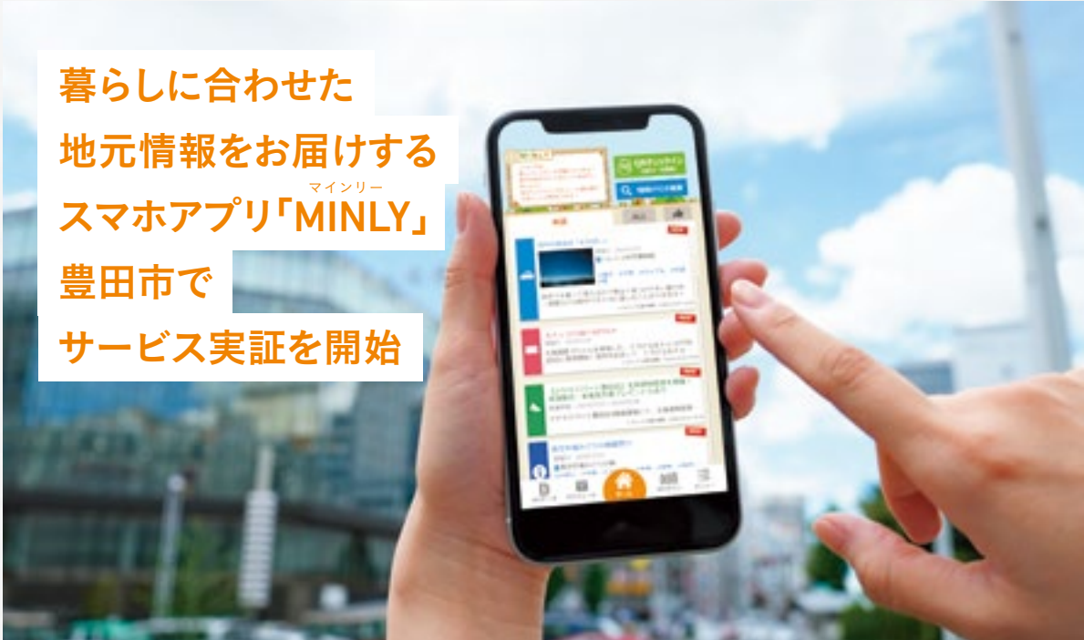
▲愛知県豊田市サービス実証をスタートした地域情報提供アプリ「MINLY」

暮らしに合わせた 地元情報をお届けする マインリー スマホアプリ「MINLY」 豊田市で サービス実証を開始